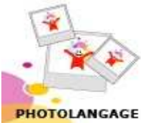
Photo langage Santé Globale (photo-expression), Cram Nord Picardie (2003)

Exposition sur la nutrition. 7 affiches A3 plastifiées. Exposition disponible à l'emprunt auprès du CODES 16.